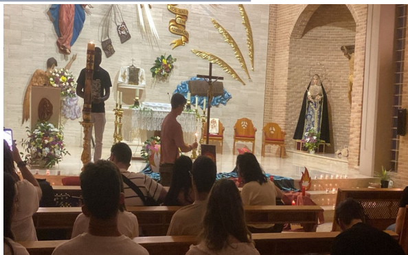
Vigilia en las hermanas carmelitas de Algoros